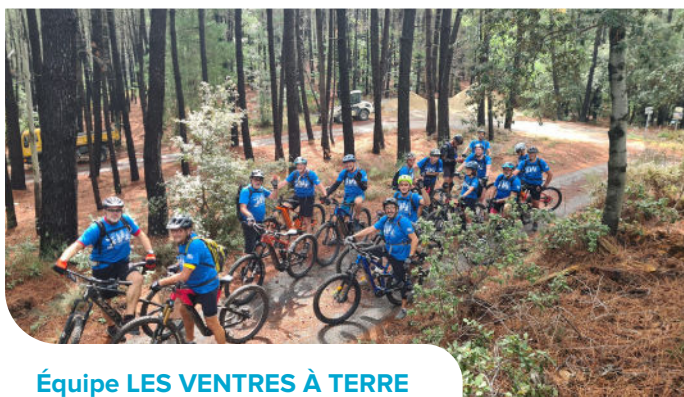
Équipe LES VENTRES À TERRE

Utilisez l'outil WETRANSFER.COM et envoyez vos éléments à 24hsp@fondationsaintpierre.org