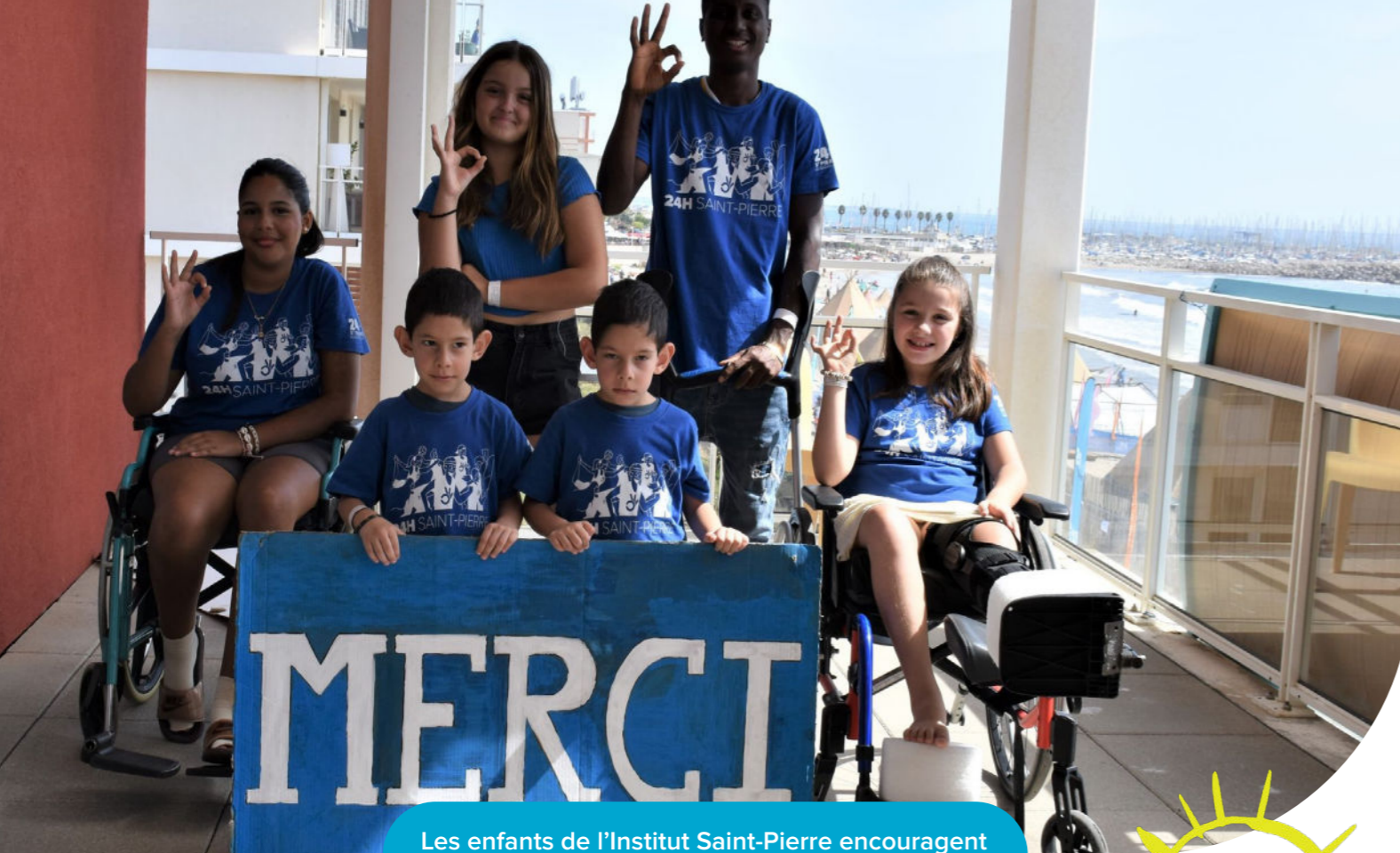
Les enfants de l'Institut Saint-Pierre encouragent les participants présents pour eux.